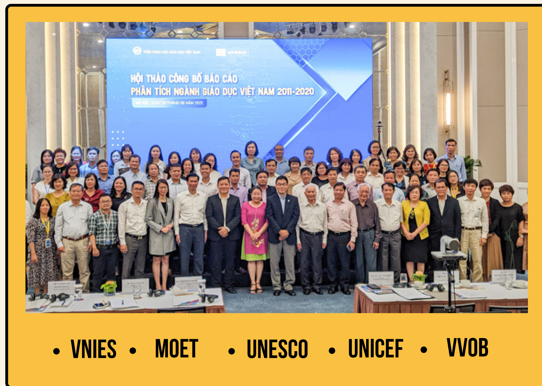
Hội thảo công bố “Báo cáo Phân tích Ngành Giáo dục 2011 – 2020” - tháng 8/2022