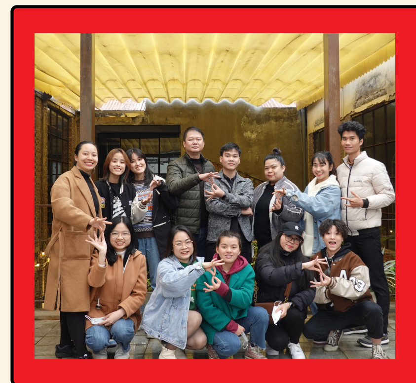
Trung tâm Đào tạo Ngôn ngữ Ký hiệu Hà Nội - Nơi ương mầm đào tạo các thế hệ phiên dịch NNKH tại miền Bắc