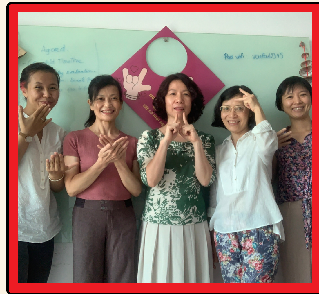
Tuyển 01 Cán bộ Chương trình - 4/2022