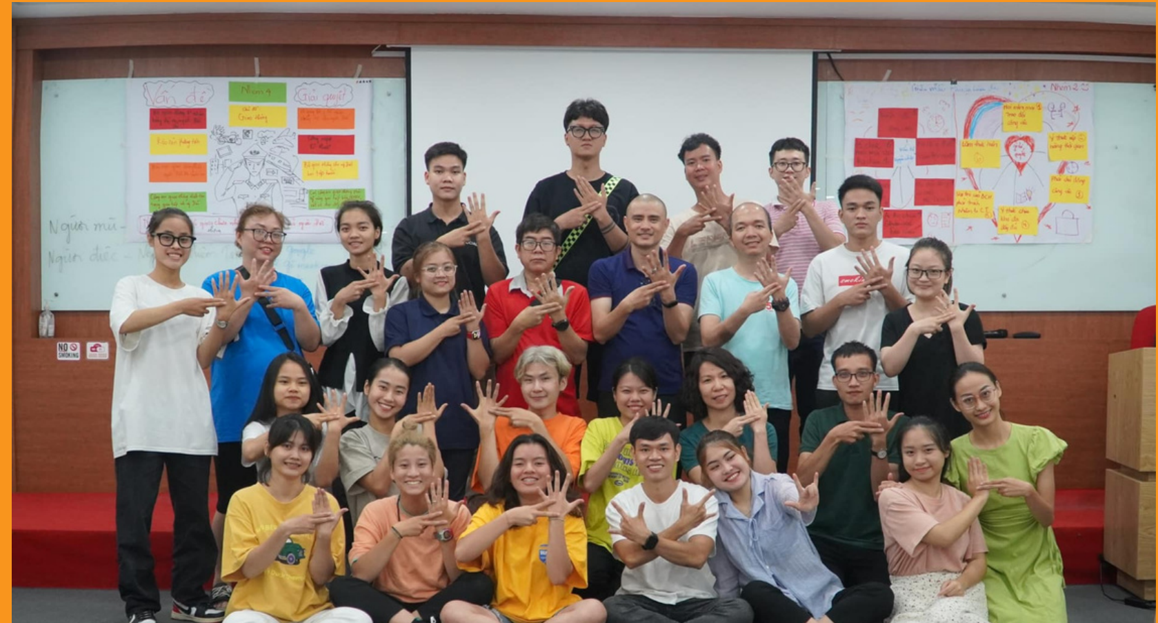
Hỗ trợ tập huấn của Chi hội Người Điếc Hà Nội - 7/2022