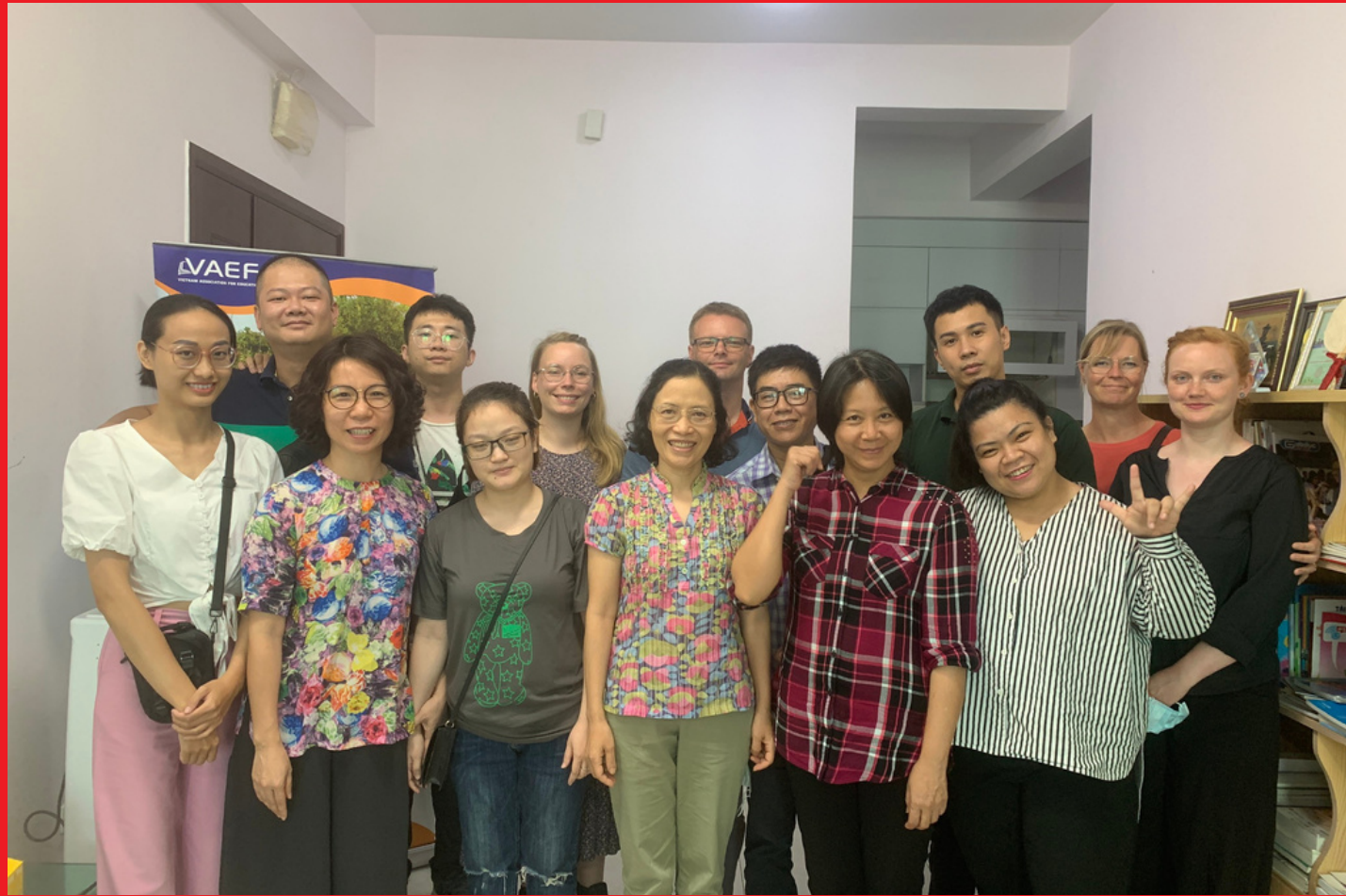
Ký biên bản ghi nhớ với Hội người Điếc Đan Mạch