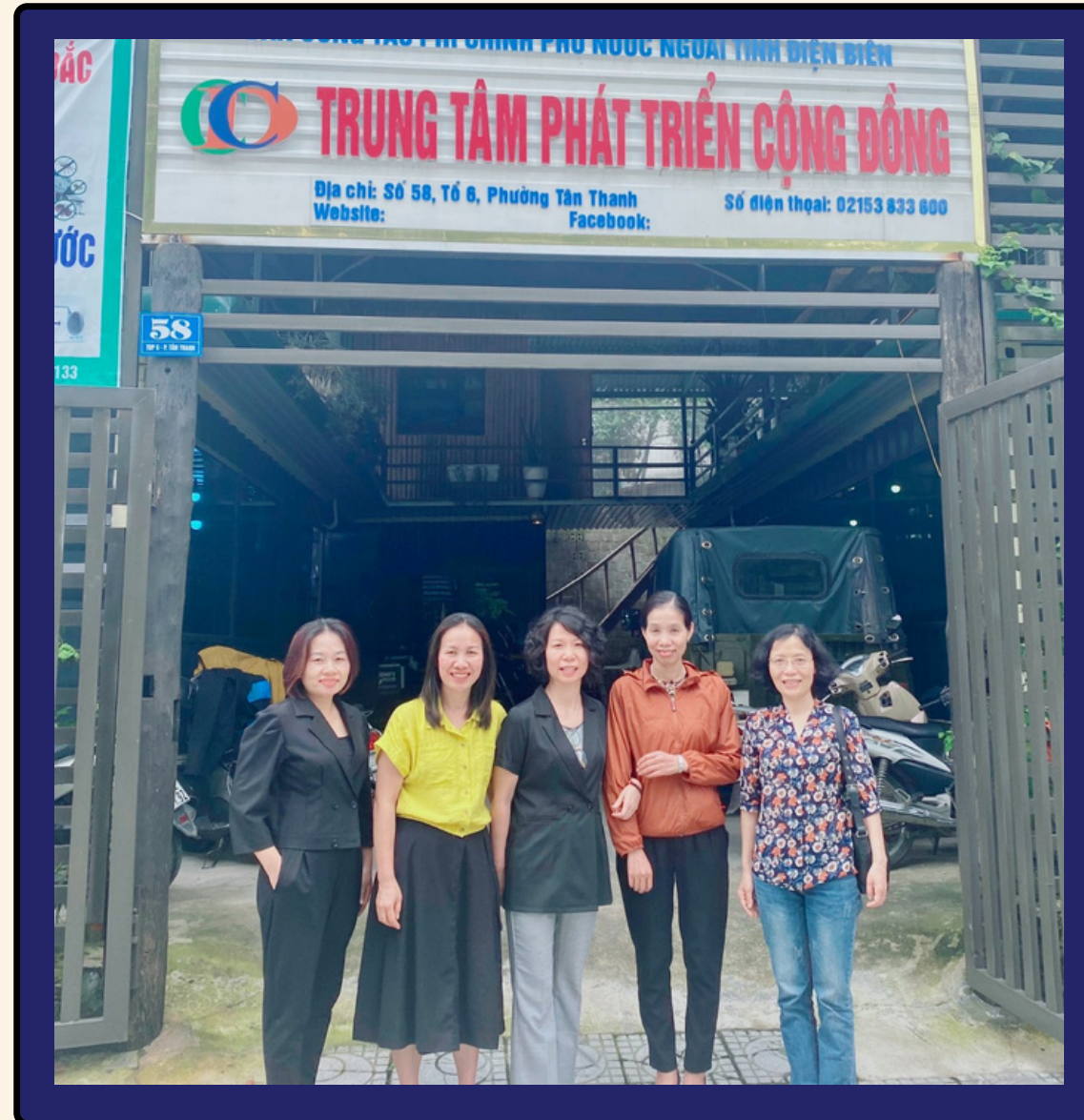
Thăm thành viên: Trung tâm Hỗ trợ Cộng đồng Điện Biên (CCD) - Tháng 5/2022