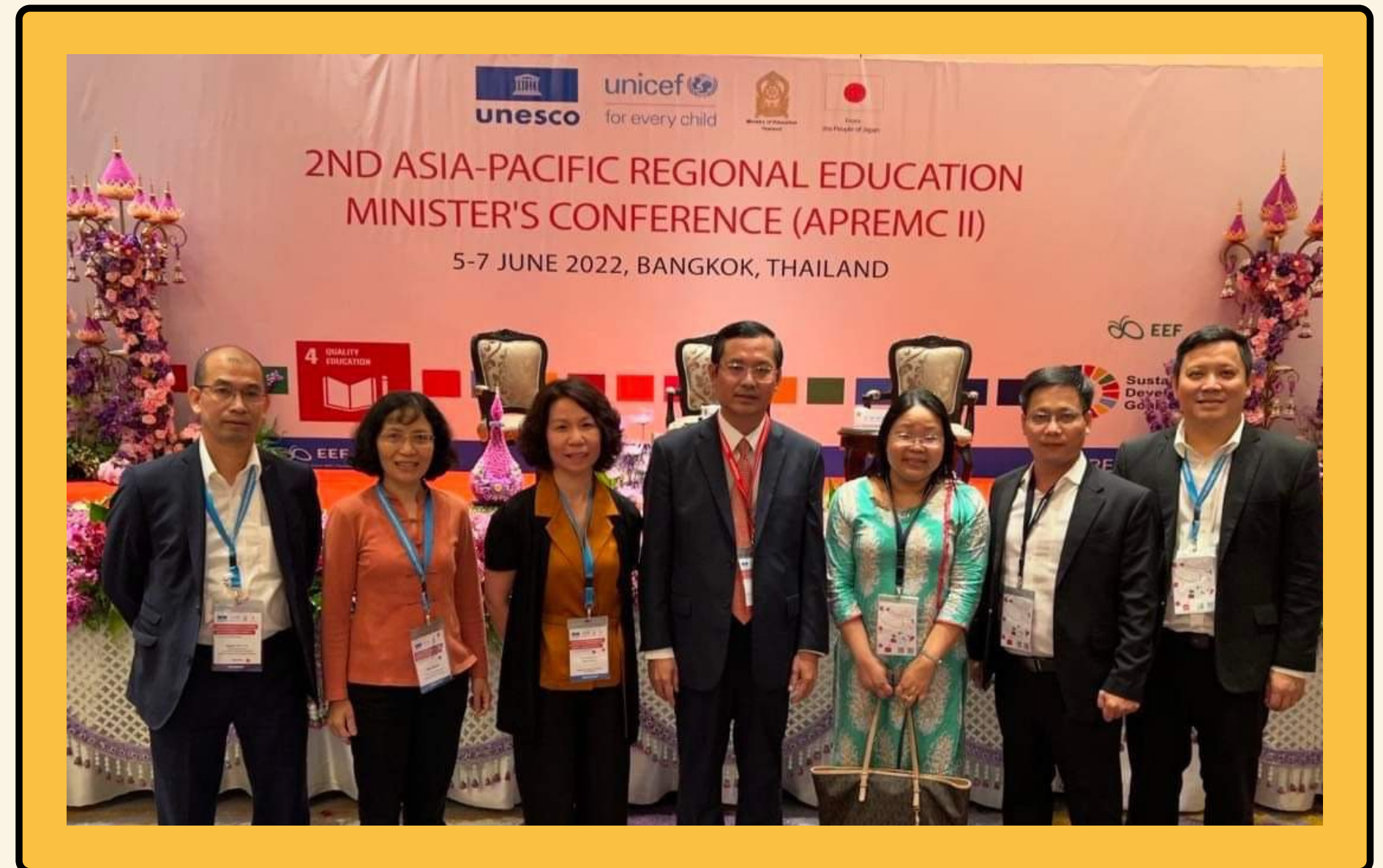
Hội nghị Bộ trưởng Giáo dục - Khu vực Châu Á Thái Bình Dương lần thứ 2 (APREMC II)