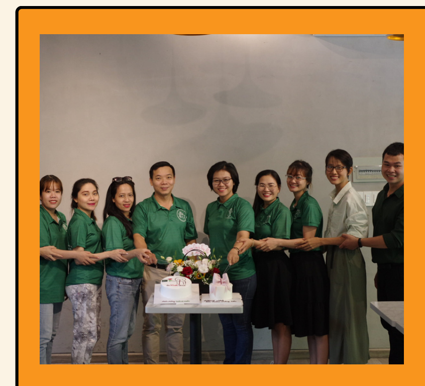
Công ty Năng Mới - tại tp Hồ Chí Minh - hỗ trợ kỹ năng giao tiếp ngôn ngữ Ký hiệu và đào tạo phiên dịch Ngôn ngữ ký hiệu miền Nam