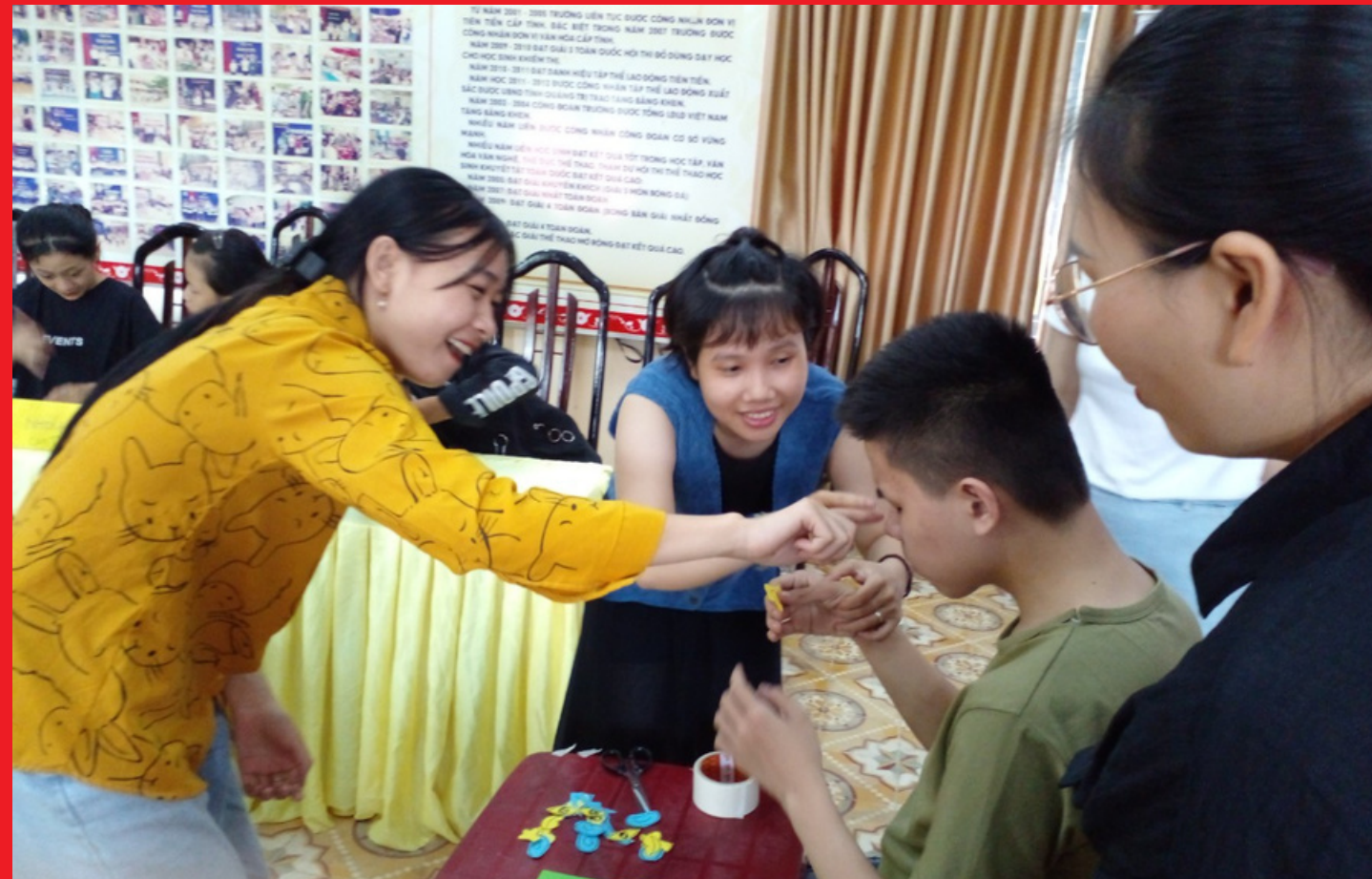
Hỗ trợ tập huấn cho thành viên Quảng Trị & Đăk Lăk - 7/2022