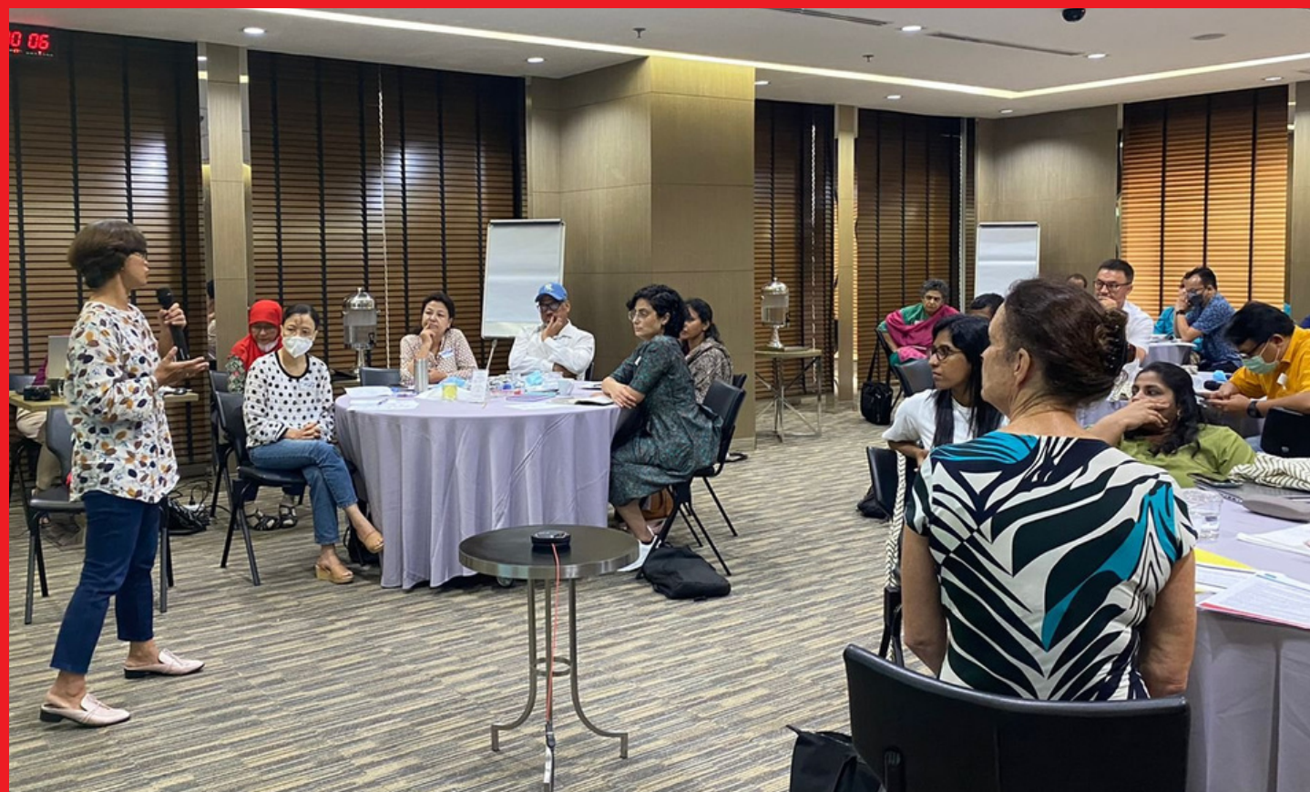
Tập huấn về giáo dục và học tập người lớn (ALE) khu vực Châu Á Thái Bình Dương