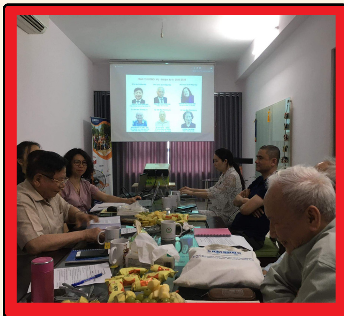
Xây dựng Quy chế Ban thường vụ - 4/2022