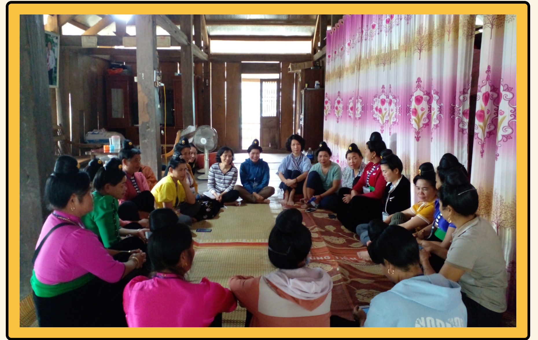
Kết nối CCD - Viện khoa học giáo dục Việt Nam thử nghiệm mô hình "Xóa mù chữ chức năng cho nhóm phụ nữ Thái" - 2022