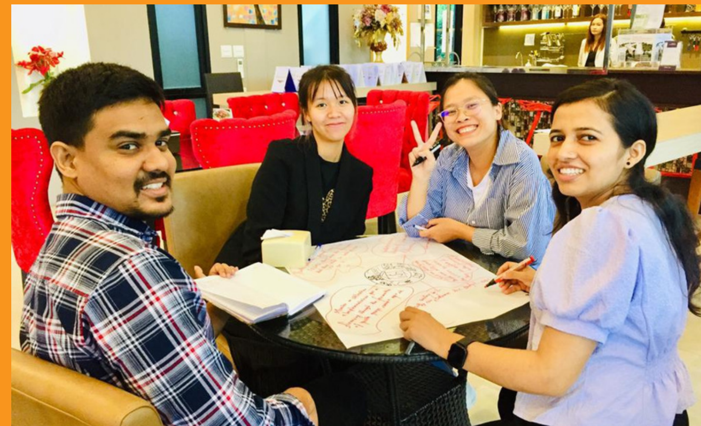
Tập huấn về tài chính giáo dục cho thanh niên khu vực châu Á Thái Bình Dương