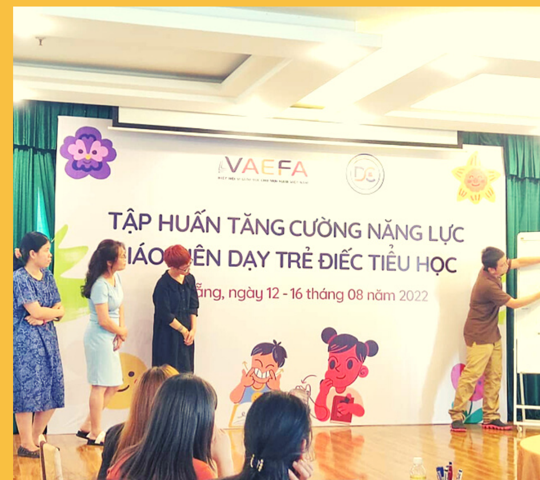
Tập huấn tăng cường năng lực giáo viên dạy trẻ điếc tiểu học - tháng 8/2022