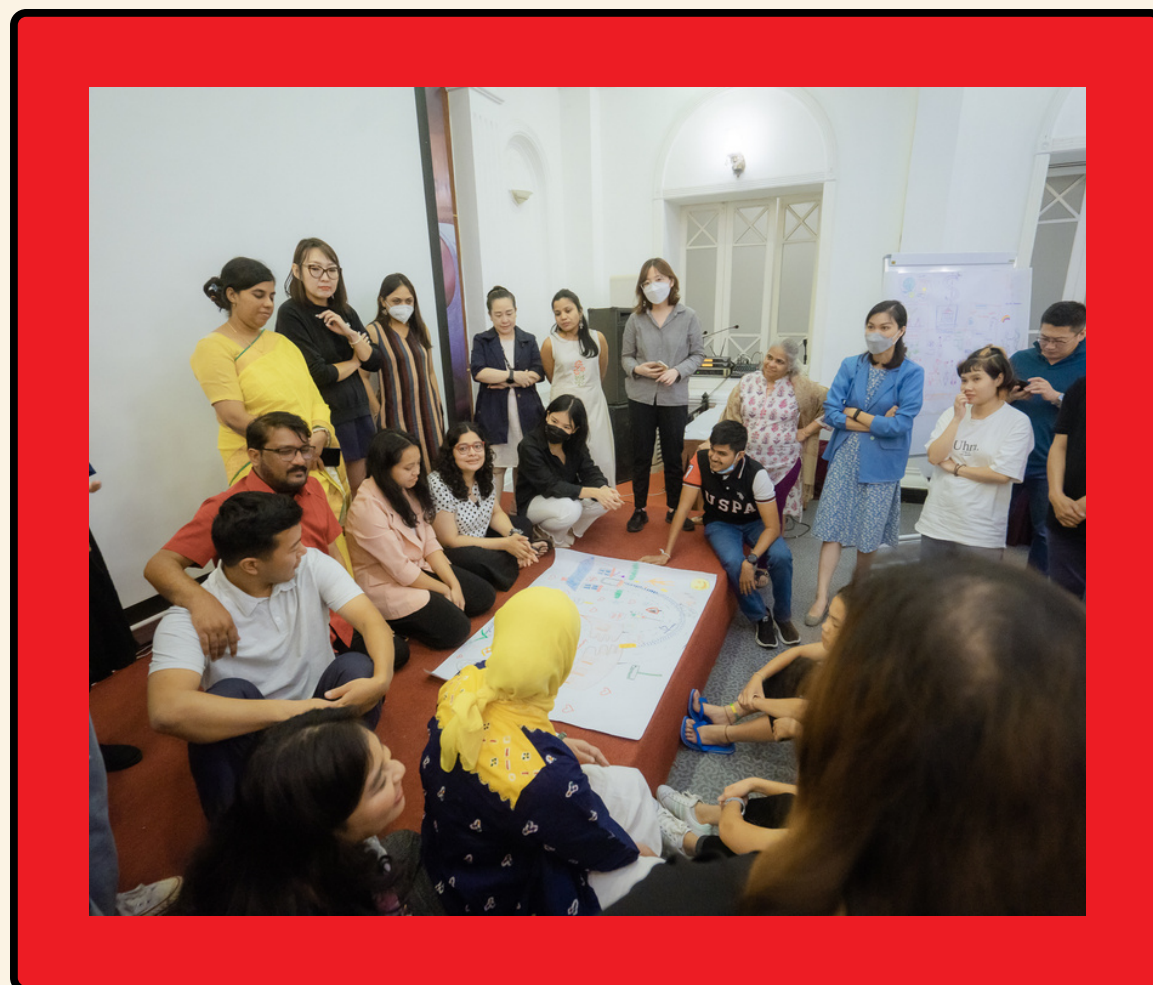
Đăng cai khóa tập huấn thường niên ASPBAE 19-24/09/2022 "Kỹ năng lãnh đạo cơ bản"